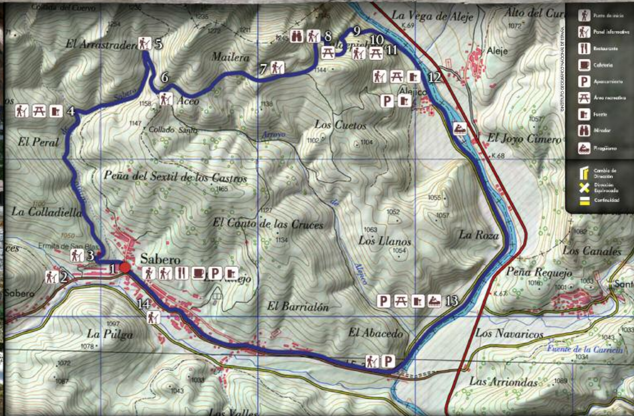
1- Museo de la Siderurgia y la Minería de Castilla y León 2- Bocamina Sucesiva 3- Ermita de San Blas 4- Fuente "la Muela" 5- Mina "La Plata" 6- Robledal Anciano 7- Mina a cielo abierto 8- Mirador 9- Mina Mariate 10- Tolva 11- Mina Imponderable 12- Puente de Alejico 13- Playas de Sabero 14- Bocamina Juanita