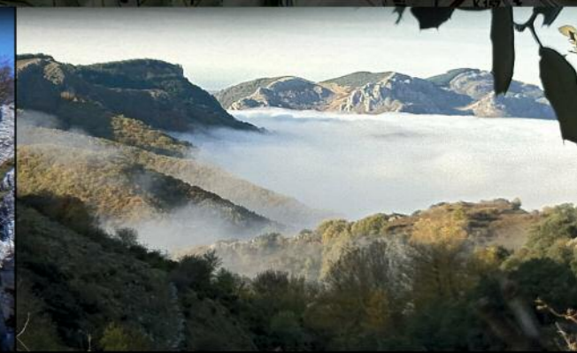
Mirador en la Ruta de las Minas (PRC-LE 60)