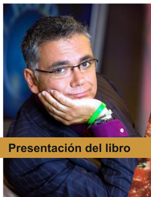
Presentación del libro